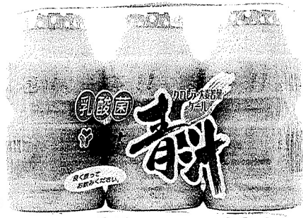
乳酸菌 青汁 (3本パック) 284円

乳酸菌の特長と、青汁の良さが生かされ黒酢、オリゴ糖の良さもプラスされた新しいタイプの飲料です!